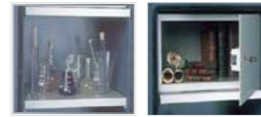
Equipements intérieurs (en partant de la gauche) : tablette, coffrets intérieurs (à clé).

L'armoire AF II peut être équipée de tablettes amovibles et de coffrets intérieurs (à clé) pour vous aider à optimiser l'utilisation de votre espace intérieur.