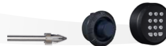
En partant de la gauche : M3B, Moneo, Nectra Basic

Nos produits sont fabriqués dans des usines certifiées ISO 9001 : 2000 et 14000. La famille ISO 9001 : 2000 traite du management de la qualité. La famille ISO 14000 traite du management environnemental.