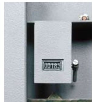
Een optionele teller betekent dat u kunt controleren of iemand in de kast is geweest.